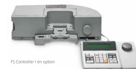
FS Controller I en option

* disponible uniquement avec l'option FS Controller I.