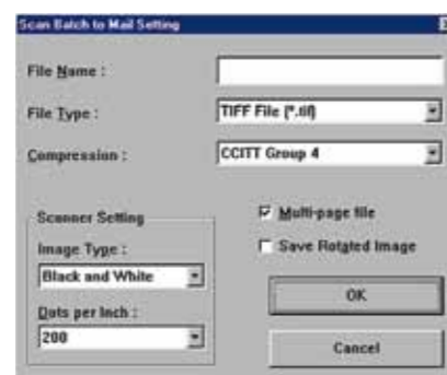
Scan Batch to Mail